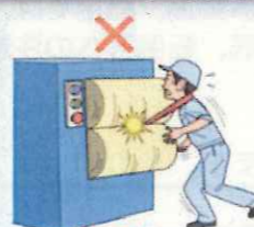
はさまれ・巻き込まれ災害