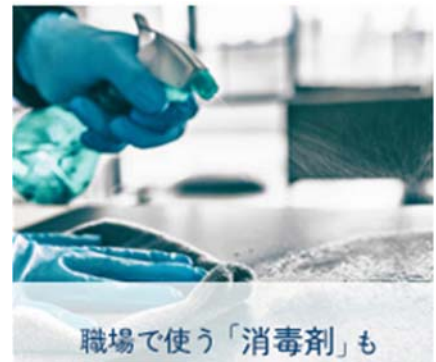
職場で使う「消毒剤」も