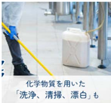
化学物質を用いた 「洗浄、清掃、漂白」も