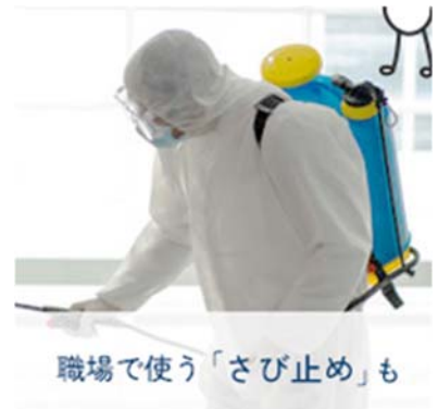
職場で使う「さび止め」も