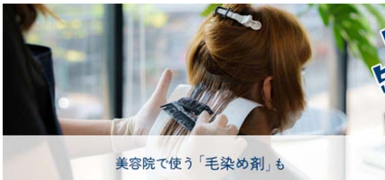
美容院で使う「毛染め剤」も