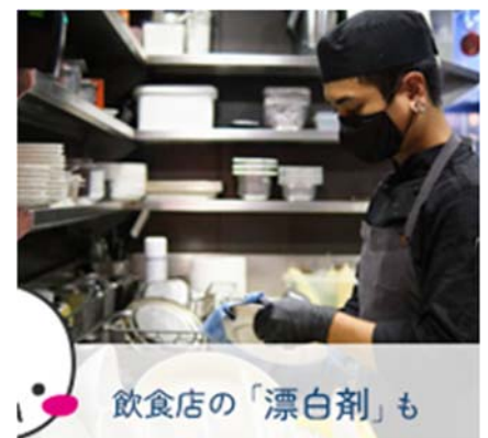
飲食店の「漂白剤」も