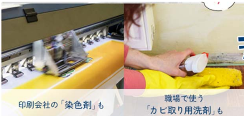
印刷会社の「染色剤」も