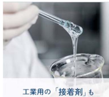
工業用の「接着剤」も