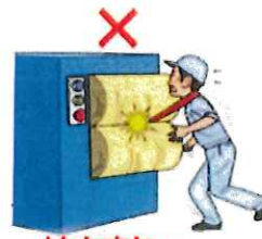
はさまれ・巻き込まれ災害