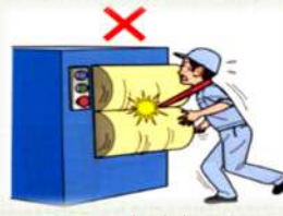
はさまれ 巻き込まれ災害