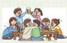
大人数や長時間の飲食