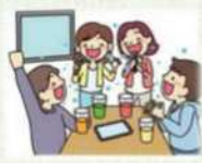
マスクなしでの会話