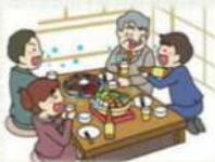
飲食を伴う懇親会等