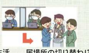
居場所の切り替わり