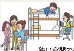
狭い空間での共同生活