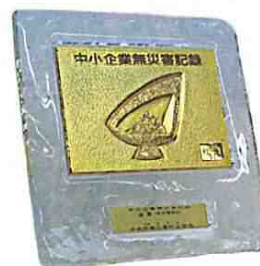
第五種(金賞) 表彰楯